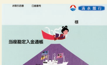
当座勘定入金通帳