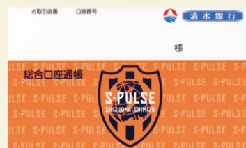
エスパルス総合口座通帳