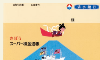
きぼうスーパー積金通帳