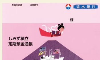
しみず積立定期預金通帳