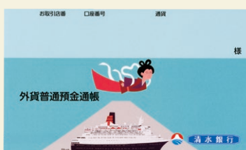
外貨普通預金通帳