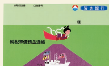
納税準備預金通帳