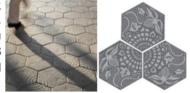
六角形モザイクタイルのモチーフ

写真家ポー・オードゥアールが撮影した、アントニ・ガウディの最も有名な肖像を緻密な彫刻で刻印。左側には、ガウディが1904年にデザインし、カサ・バトリョやカサ・ミラの床、グラシア通りの歩道などに使われている代表的な意匠の一つである六角形のモザイクタイルを配置。コインの周囲には、グエル公園の入り口にある建物の屋根根をモチーフにしたモダニズム様式の装飾を刻印するなど、ガウディ建築の象徴的な美学を添えています。上部には、「Antoni Gaudi」と刻印。