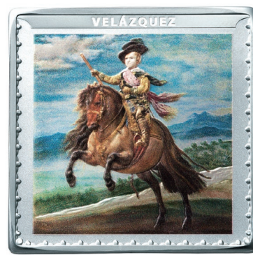
プラド美術館200周年記念コイン